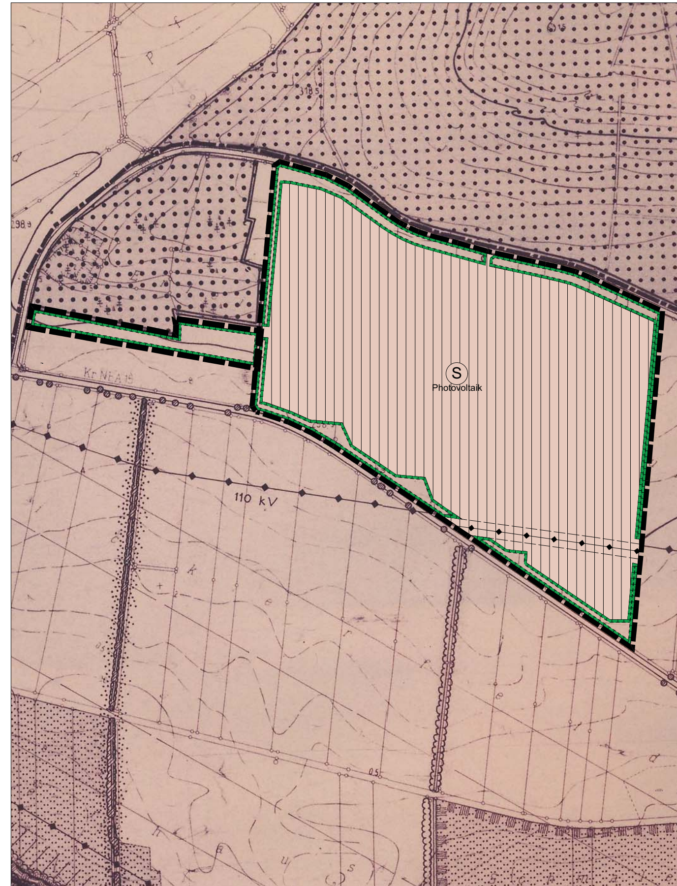
Kartengrundlage: Flächennutzungsplan, digitalisierte Fassung